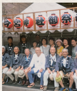
提灯の取り付けや神酒所の設置も町会員で協力しあい一致団結

昨年からは、祭りの日に音羽青年会と講談社が共催で「音羽こどもまつり」を開催しています。ヨーヨーやかき氷、輪投げなど、子ども達には楽しい催しですが、イベントが増えると両天秤になって人が散ってしまうのが悩みの種。特に今年は3年に一度の大祭です。1t近い宮御輿は300