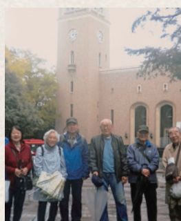
早稲田や本郷など、近くで散策する会を年に数回実施している

特に今年は、宮神輿を地元人間が担ぐように改革しようという話もあります。以前、祭の日に盆踊りをやって宮神輿の担ぎ手が足りなくて神輿会に手伝いを頼んだら、いつの間にか彼らの方が多くなってしまつて。彼らの手伝いを断つて宮神輿はあがるのか、どうするか、あと4ヶ月で話をまとめるか、あといけないので大変です。本当は小さな町会同士は合併したらいいんだろうけど、会計状況も人数も規模も違うからなかなか難しい。地下鉄ができた時に、この機会に町会を再編しようという話が出て、この人なら!という人物がまとまろうと尽力したけれど、ついに実現はしませんでした。人をまとめるのはとにかく大変。まずは祭りが成功するように頑張ります!