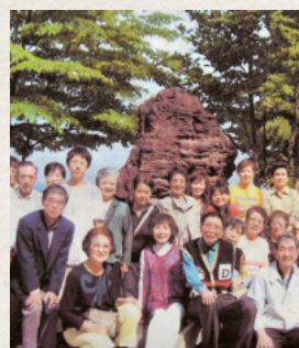
日帰り旅行や歌舞伎鑑賞会など、町会イベントも多い

町会運営は大変な仕事です。そこで私はまず、副会長を2名から7名に増やして、警察や消防など役割分担を決めました。仕事を分散すると働きながらも町会活動ができるので、副会長にリタイア組は一人もいません。会長が何でもやってしまうと組織や後継者が育たないので、人材育成のためにも、副会長は増やした方がいい。そして、10年ぐらいで会長は辞めなきゃとも思います。トップが変わらないうと組織は若返りができません。「文京第5団」では、隊長は3年でやめる取り決めをしました。1年目は先輩に教わり、2年目は自立、3年目は後継者に引き継いでいく。当町会も10年を目安に交代していく、次世代につながる町会運営を目指しています。