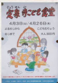
定泉寺で子ども食堂が開催されるなど、寺社町らしい取り組みも

私は町会長と共に、この地区の青少年健全育成会の会長も20年ほどやっていて、そちらでも運動会をやったり、プールに遊びに行ったり、年6〜7回イベントを行っています。地域の子ども達の為の活動を通して、若い世代も参加しやすいよう学校とも連携していきたいですね。また、その他に民生委員もやっていますが、高齢者の介護や医療面も、徐々に行政から町会を主体とした地域で支えるようになるだろうと感じています。町内の高齢者は今後益々増えますし、若い世代を上手に取り込んで、地域で支えあつて暮らしていけるようにしなければと思います。