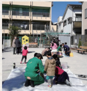
会場となる本駒込三丁目児童遊園。プレイパークで遊びながら防災意識を高める

「吉片」と呼ばれるエリア 2つの旧町名を合わせて 吉片町会は、本郷通りを挟んで両側に広がる町会です。この界隈は寺社が多く、東大のあたりから富士神社にかけて42もあります。これは、明暦の大火（振袖火事）で、水道橋にあった吉祥寺をはじめ多くのお寺がこちらへ移り、街道沿いに門前町ができたため、吉祥寺門前町と境内を合わせて駒込吉祥寺町、通りを挟んでその西側の片町を駒込片町と呼び、その2つの旧町名を合わせて吉片町会と名付けられました。町内にも5つお寺があり、12月の餅つきは定泉寺の境内で行うなど、町会イベントにご協力をいただいています。